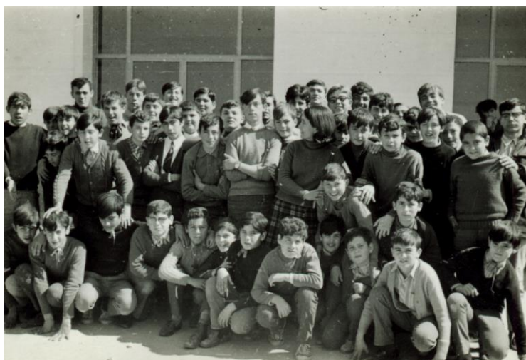
3º de Bachiller masculino, un solo curso con 52 alumnos matriculados